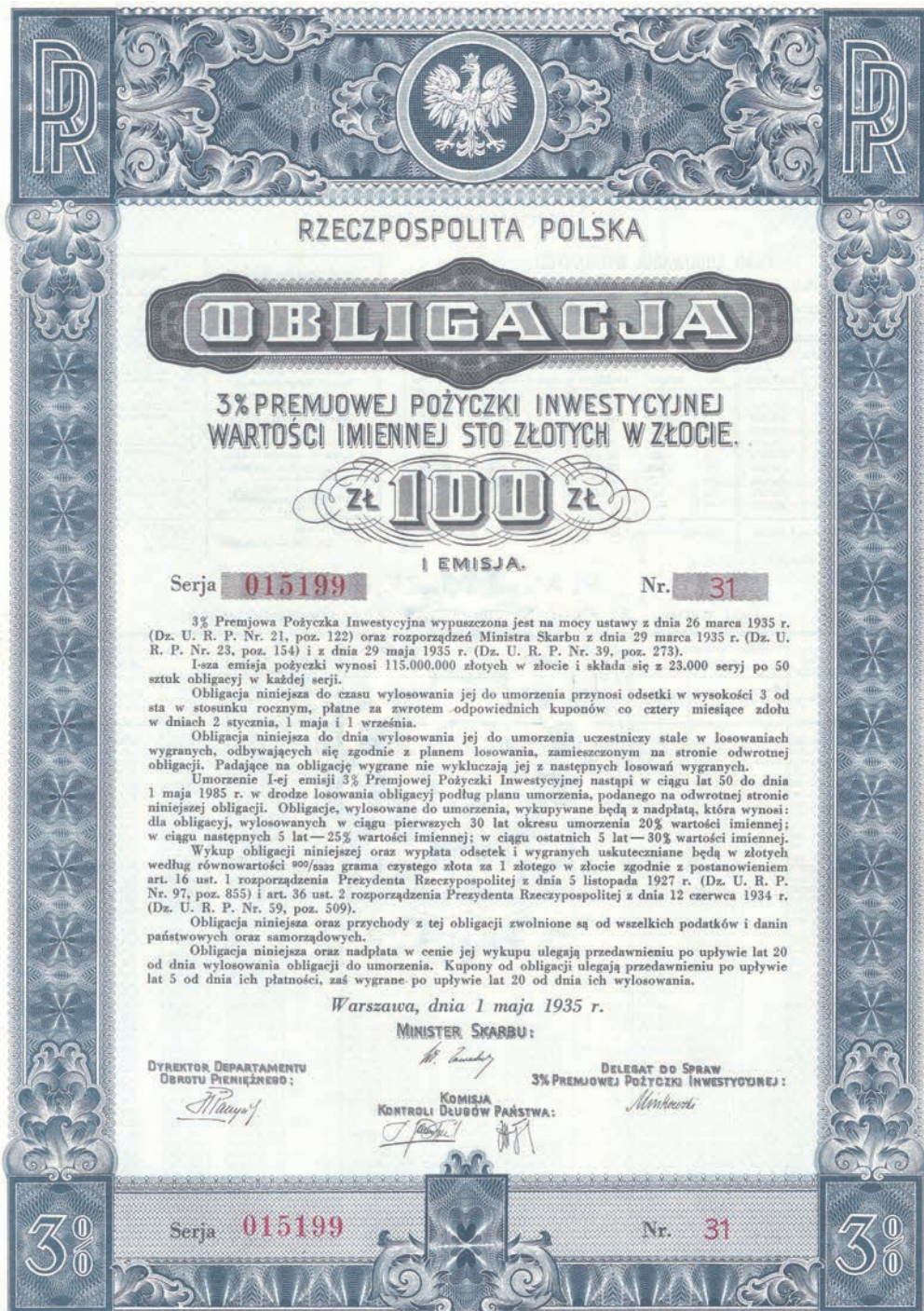
Rysunek 3. Obligacja I emisji Premiowej Pożyczki Inwestycyjnej (1935 r.) (Figure 3. A bond of I emission of the Premium Investment Bond from the year 1935)