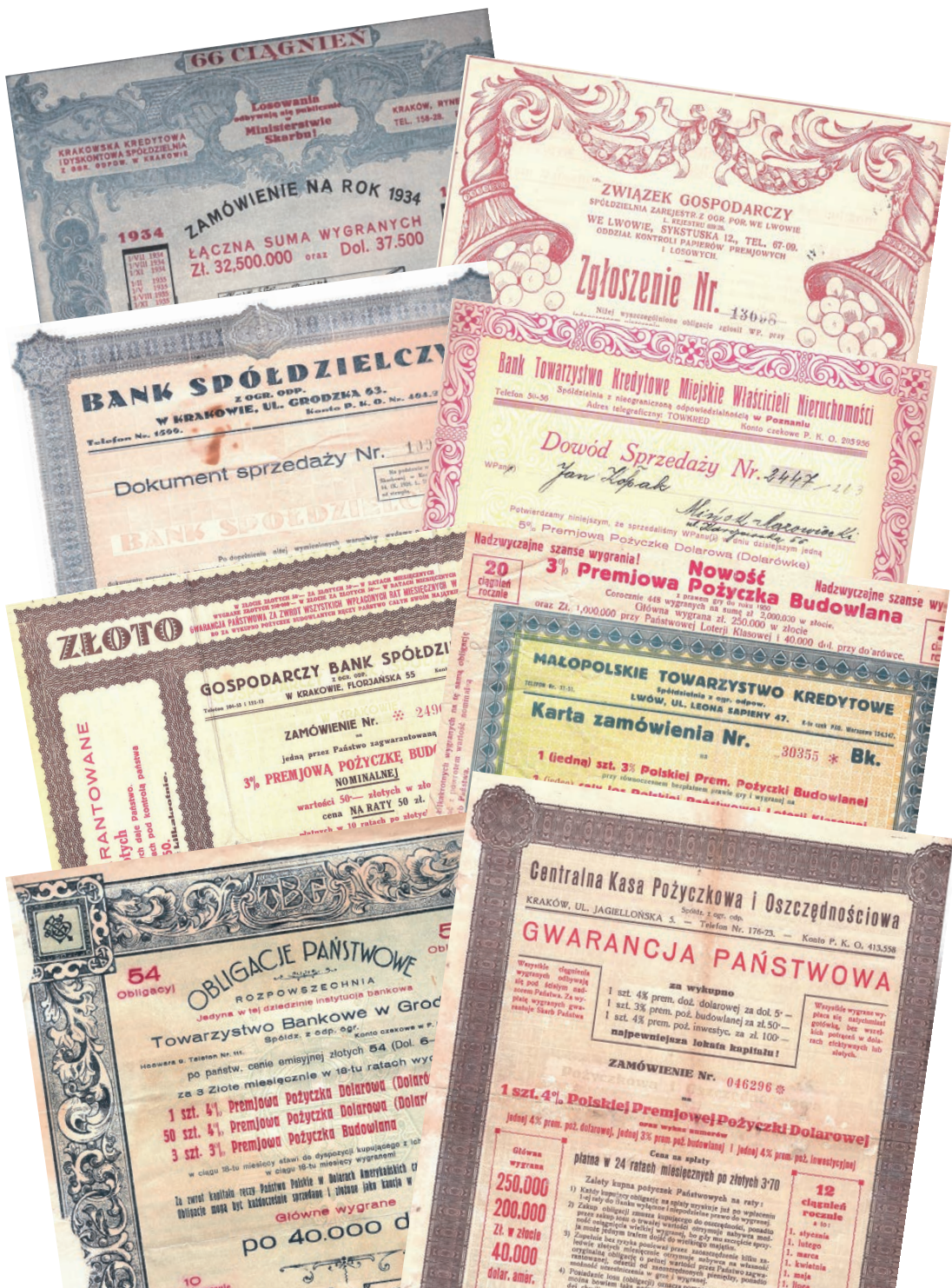
Rysunek 14. Oferty marketingowe instytucji finansowych z Krakowa, Poznania, Lwowa i Grodna (Figure 14. Marketing offers of financial institutions from Kraków, Poznań, Lwów and Grodno)