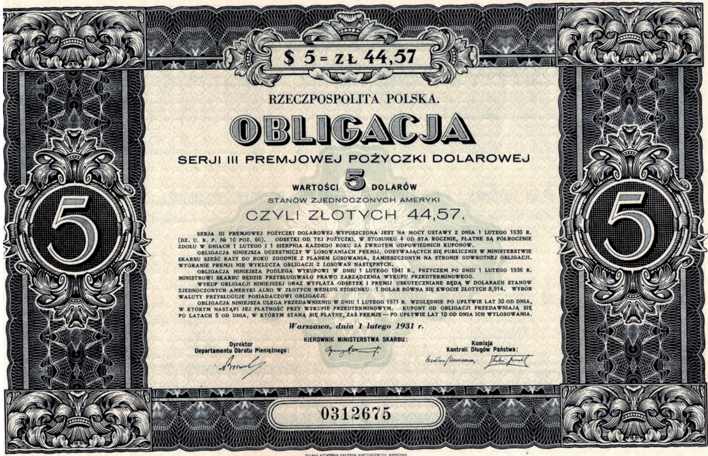
Rysunek 2. Obligacja III serii Premiowej Pożyczki Dolarowej (1931 r.) (Figure 2. A bond of III series of the US Dollar Premium Bond from the year 1931)