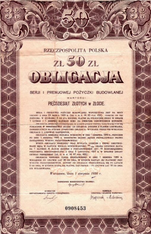
Rysunek 1. Obwieszczenie w sprawie emisji I serii Premiowej Pożyczki Budowlanej oraz obligacja na okaziciela o wartości 50 złotych w złocie (1930 r.) (Figure 1. An announcement about emission of the I series of the Premium Construction Loan and a 50 PLN bond to the bearer in gold from the year 1930)

Całkowita emisja powyższej pożyczki została przejęta przez syndykata gwarancyjny następujących banków: Bankowa Kasa Oszczędności (P. K. O.) Bank Przemysłowo-Handlowy Bank Spółdzielczy w Warszawie Bank Spółdzielczy w Krakowie Bank Spółdzielczy w Katowicach Bank Spółdzielczy w Łodzi Bank Spółdzielczy w Poznaniu Bank Spółdzielczy w Wrocławiu Bank Spółdzielczy w Bydgoszczy Bank Spółdzielczy w Gdyni Bank Spółdzielczy w Lublinie Bank Spółdzielczy w Szczecinie Bank Spółdzielczy w Toruniu Bank Spółdzielczy w Żarach Bank Spółdzielczy w Zielonej Górze Bank Spółdzielczy w Żyrardowie