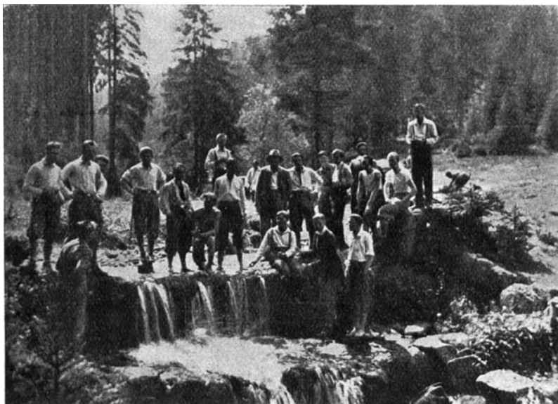
Wycieczka uczniów III. Gimnazjum nad wodospadem Wisły.

Źródło: Sprawozdanie Państwowego Gimnazjum III im. A. Mickiewicza w Tarnowie za rok szkolny 1931/32, s. 6.