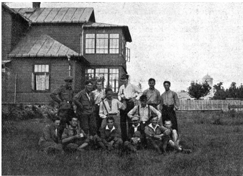
Wycieczka uczniów III. Gimnazjum w Góry Świętokrzyskie. Przy schronisku na Łysicy.

Źródło: Sprawozdanie Państwowego Gimnazjum III im. A. Mickiewicza w Tarnowie za rok szkolny 1931/32, s. 6.