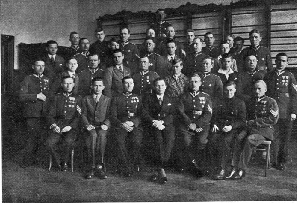
Kurs oświatowy z zakresu VII kl. szkoły powszechnej dla podoficerów 16 pp., prowadzony przez „Związek pracy dla Państwa“ uczniów III. Gimnazjum w Tarnowie.