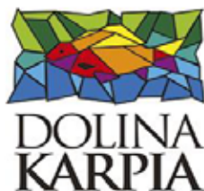
Rysunek 3. Znak marki lokalnej Dolina Karpia (Figure 3. Local trademark of the Carp Valley)

nicy znaków marki lokalnej, korzystając ze wspólnej i zintegrowanej promocji, będą bowiem uczestniczyć w wydarzeniach promocyjnych na korzystnych warunkach, brać udział w spotkaniach aktywizujących, wyjazdach studyjnych, szkoleniach i warsztatach. Posiadając dodatkowe narzędzia w postaci tablic i statuetek witrażowych, będą promować markę lokalną Dolina Karpia wśród osób odwiedzających obiekt, a także w trakcie wydarzeń promocyjnych, kulturalnych lub aktywizujących społeczność lokalną, w których obiekt będzie brał udział, jak również podczas wydarzeń organizowanych poza Doliną Karpia. Dzięki posiadaniu znaku marki lokalnej zwiększą swe szanse na dofinansowanie rozwoju w ramach wdrażania LSR, gdyż LGD przewidziała w kryteriach wyboru operacji punkty dla użytkowników znaku marki lokalnej Dolina Karpia.