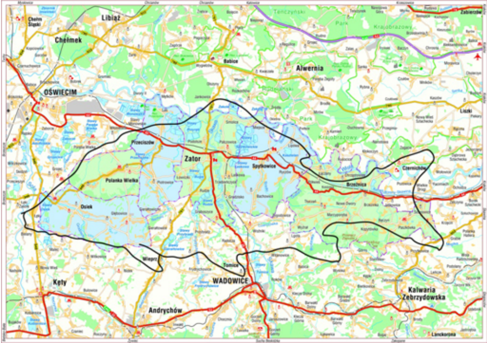
Rysunek 1. Dolina Karpia (Figure 1. The Carp Valley)