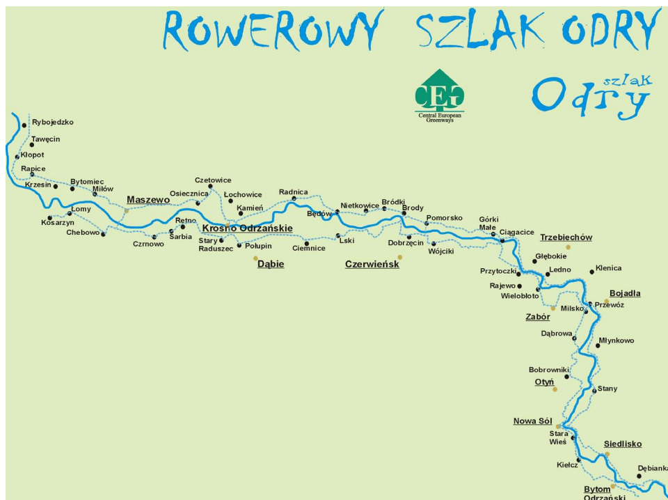
Rysunek 2. Fragment przebiegu Rowerowego Szlaku Odry (Figure 2. The part of Odra Bike Track)